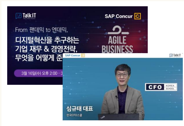
[토크IT] 기술혁신과 팬데믹 시대의 기업재무회계의 역할