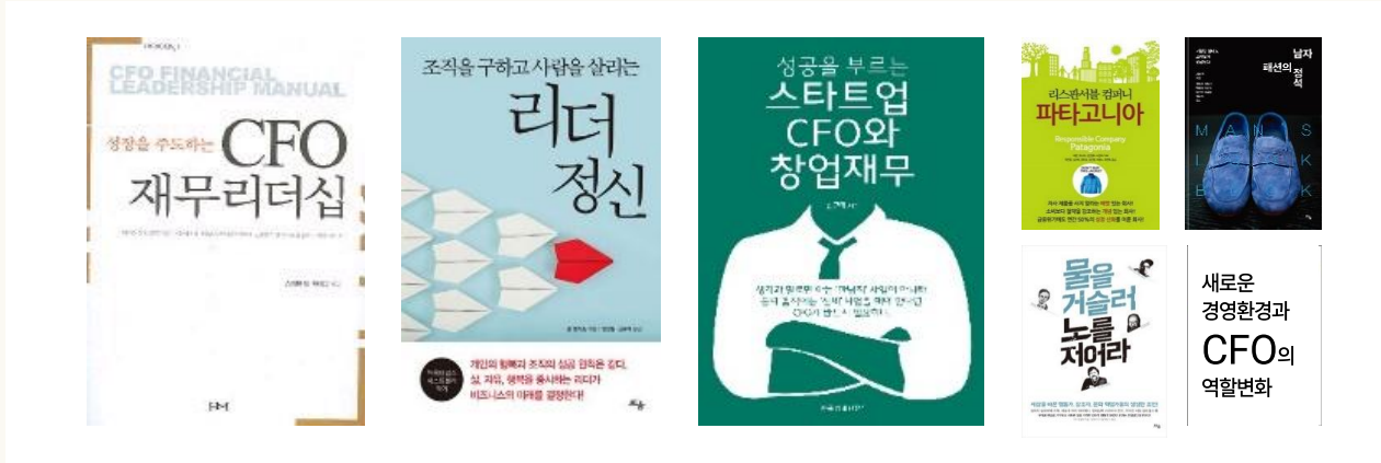
[저서/역서] 성장을 주도하는 CFO 재무리더십 / 리더정신 / 스타트업 CFO와 창업재무 / 새로운 경영환경과 CFO의 역할변화 / 물을 거슬러 노를 저어라 / 리스판서블 컴퍼니 파타고니아 / 남자패션의 정석