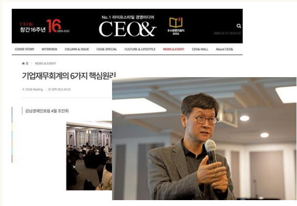
[CEO&] 강남경제인포럼 조찬회 기업재무회계의 6가지 핵심원리