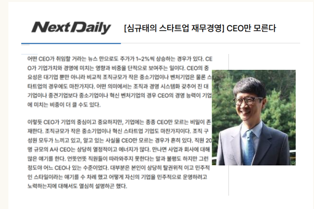
[넥스트데일리] [심규태의 스타트업 재무경영] CEO만 모른다